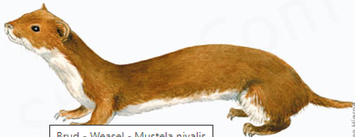
Brud - Weasel - Mustela nivalis

Bruden er et rovdyr, som især spiser mus og småfugle. Men den tager også fuglææg, frøer samt insekter og smådyr.